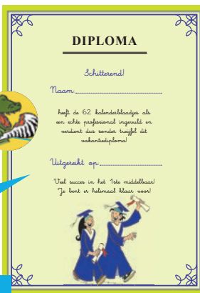
Voorbeeld vakantiekalender leerjaar 6